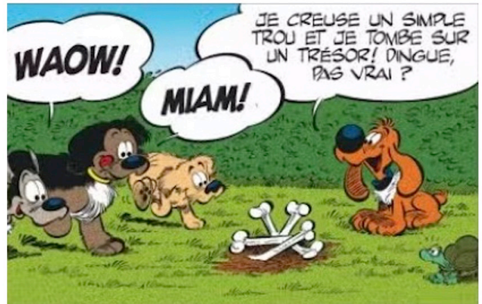
Extraits des albums n°16 et n°41 de Boule et Bill